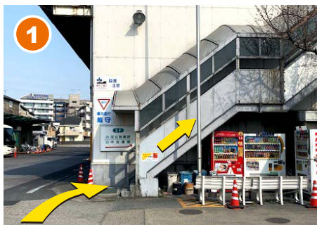
1 入って正面にある階段を上り、2階に行きます。