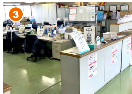
3 庶務課の奥に「中古車部 事務所」があります。